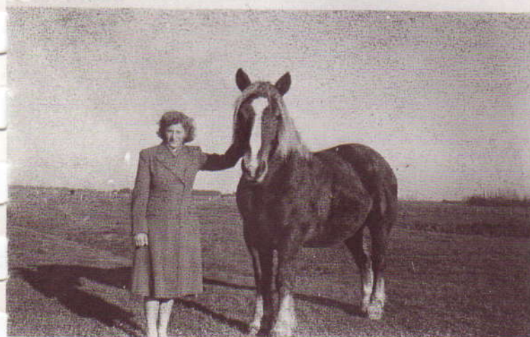
Ons paard de 'Vos'. Hier deden we alles mee. Ook naar de Veiling rijden. Erg lief dier, schapmak. Was als ons kind en werd ook als zodanig erg verwend!