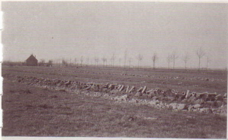
De tuin aan de Ariaansweg wordt gedraineerd. Rechts de Groene Kruisweg. Dit is nu de wijk Oudeland-Hoogvliet.