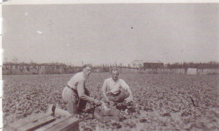
Met Dingeman in de sla.