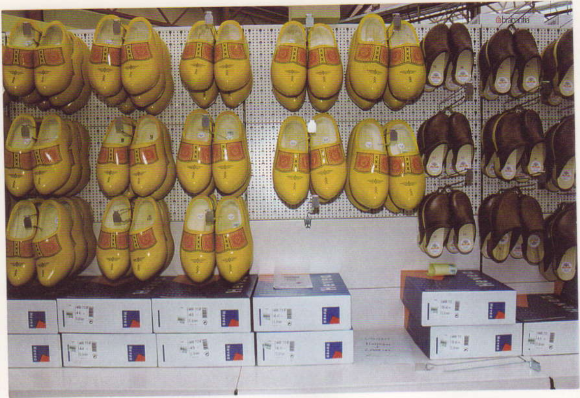
Klompn in soorten.